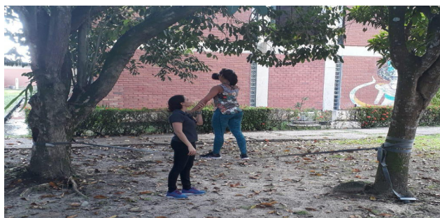
Figura 4. Demonstração do segundo experimento.

No segundo experimento, o participante caminhava com e sem a utilização de óculos de realidade virtual no solo e em equipamento slackline 1 (Figura 4). Esse experimento permitia ao participante avaliar as influências da superfície de contato, das informações visuais, proprioceptivas e táteis no equilíbrio. As observações e sensações dos participantes possibilitavam a discussão sobre o funcionamento integrado de diferentes sistemas corporais para a manutenção do equilíbrio e boa execução das funções diárias e das bases neuroanatômicas e funcionais que permitem ao sistema nervoso comunicação e adaptação.