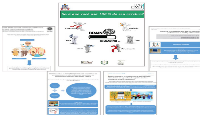
Figura 2. Banner “Será que você usa 100% do seu cérebro?” ao centro e quatro roteiros didáticos em formato de banner digital utilizados como apoio às discussões.

Foram elaborados e impressos três banners com os temas: “será que você usa 100% do seu cérebro?”, “você sabe como proteger seu cérebro?” e “você sabe como turbinar seu cérebro para os estudos?”. A atividade central deste trabalho situa-se nas discussões sobre a pergunta: “será que você usa 100% do seu cérebro?”, usando o primeiro banner como disparador para a interação com a população. Além disso, foram planejados roteiros didáticos em formato de banner digital sobre os principais assuntos de discussão com base em resultados de estudos publicados pelo grupo de pesquisa ou com dados inéditos de pesquisas em andamento (Figura 2).