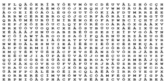
Figura 3. Instrumento utilizado no primeiro experimento.

seu cérebro?”. Para isso, iniciávamos com o questionamento e deixávamos o participante formular seu pensamento sobre o assunto. Em seguida, o convidávamos a realizar o experimento, no qual deveria pesquisar em um caça-palavras a palavra “cérebro” que se dispunha em todas as direções (Figura 3) e, ao mesmo tempo, deveria ouvir uma história, lida pausadamente e, simultaneamente, contar quantas vezes foi mencionada a palavra “cérebro”. Era perceptível a dificuldade, por conta da divisão dos recursos atencionais. O participante era, então, questionado a respeito da experiência a partir da qual estabelecíamos a discussão e explicação embasada em estudos científicos.