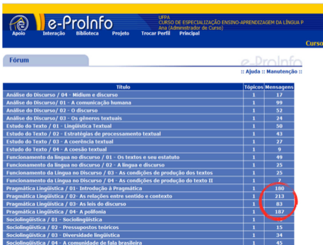
Figura 4: Discussões do fórum da turma de 2007

Apesar de não ser obrigatória a participação discente nas discussões do fórum – ou seja, o aluno não ser avaliado por essa participação –, a utilização da ferramenta também é considerada uma atividade pedagógica, paralela às atividades que estes desenvolvem a cada semana (leitura, elaboração de textos, etc.). As tutoras, então, tentam estimular a participação dos alunos. Nesse espaço virtual, eles podem apresentar seus questionamentos sobre os textos que estão em discussão durante um determinado período e as professoras podem também incentivar novas discussões, apresentando questionamentos não previstos nas atividades iniciais. A experiência com a oferta do curso, entre os anos de 2004 e 2009, nos mostrou que a maioria dos alunos participa postando mensagens (alguns mais frequentemente do que outros), mas mesmo os que não efetuam postagens costumam ler as mensagens registradas, o que, para nós, confirma a importância da ferramenta.