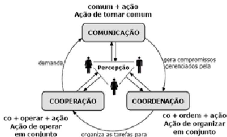
Figura 2: Esquema de Colaboração (Fuks et al. : 2005, p. 20)

A representação do esquema da colaboração, proposto pelos autores, permite a percepção da complexidade do trabalho a ser feito em cursos online tendo-se o fórum de discussão como espaço de interação com finalidade pedagógica. É interessante observar, no esquema de Fuks et al. (2005, p. 20), a maneira como demonstram ver o que chamam de coordenação : uma atividade conjunta, e não atribuída somente ao professor. Trata-se de uma visão que parte do princípio de que todas as atividades envolvidas são desempenhadas pelo grupo, e não atribuídas ou monopolizadas por um ou outro participante.